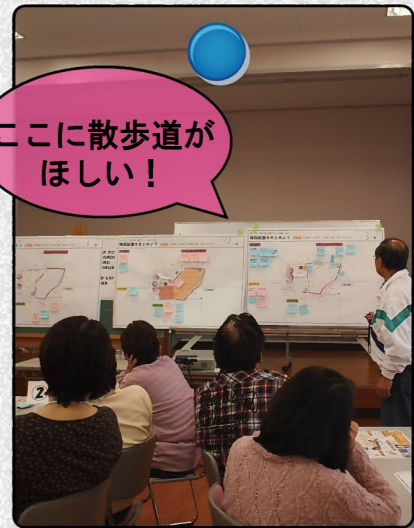
■施設を配置してプランをまとめよう！