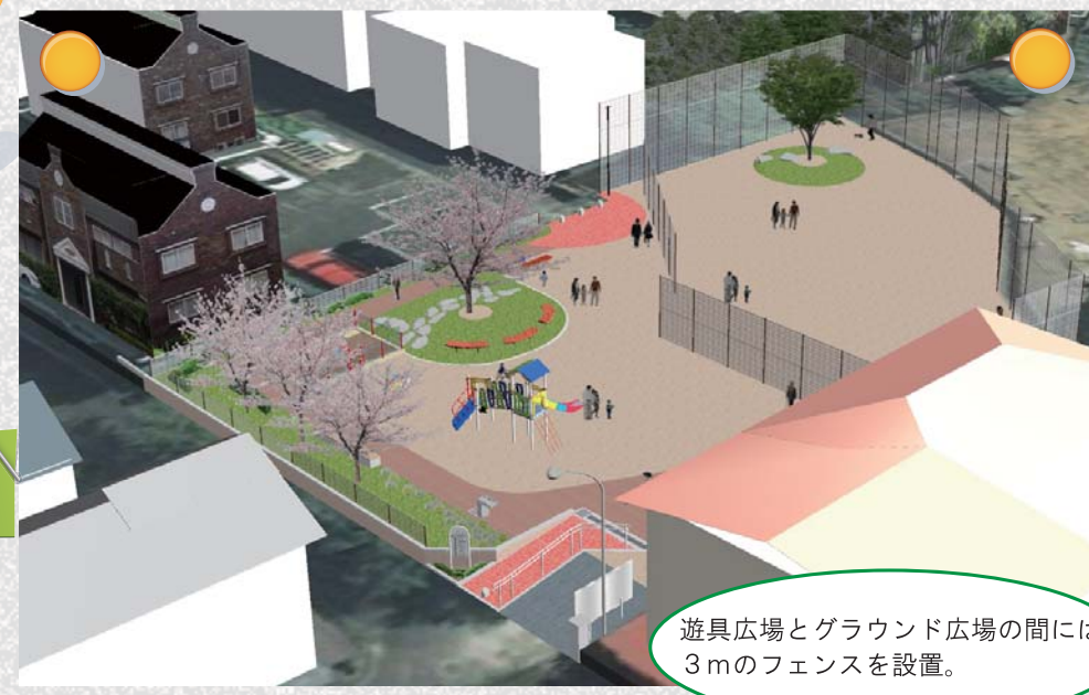
遊具広場とグラウンド広場の間には3mのフェンスを設置。