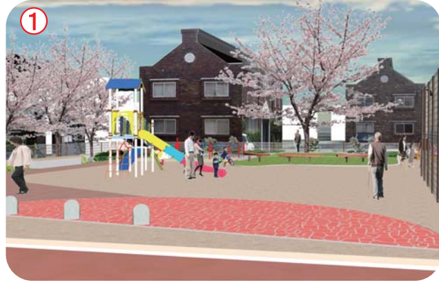
公民館前からの見たエントランス広場 公民館と公園が一体となったエントランス広場。