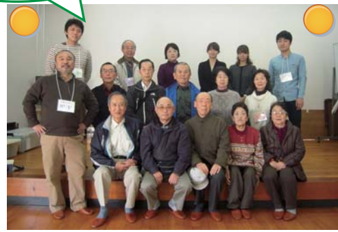
これが、私たちが4回を通してまとめた計画です！

福岡市では、この計画をもとに、平成25年度（平成26年3月）内の完成を予定しております。尚、CGはあくまでイメージであり完成とは異なる場合があります。