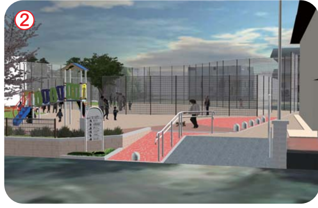
北側道路からの見たエントランス入口 門柱や案内板を移設・撤去し、広々としたエントランス入口。