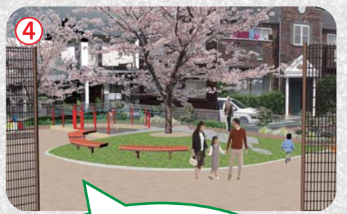
既存の桜を中心に、遊具で遊ぶお子さんを見守れるベンチを設置。