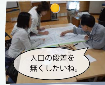
入口の段差を無くしたいね。