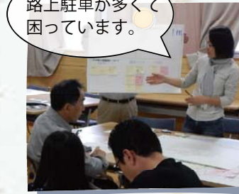
路上駐車が多くて困っています。