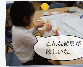
こんな遊具が欲しいな。