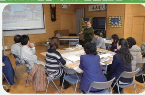
・前回のふりかえりをしよう

福岡市では、公園再整備事業の一環として薬院公園を再整備いたします。改修するにあたり、地域の皆さんの意見を取り入れ、より良い公園につくり変えたいと思っております。皆さんとの話し合いを下記スケジュールで設定しておりますので是非参加ください。途中参加、1回のみでの参加でも大丈夫です。 多数のご参加をお待ちしています！