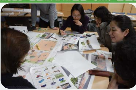
・施設のタイプを話し合おう