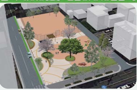
・CGで検討案を確認しよう