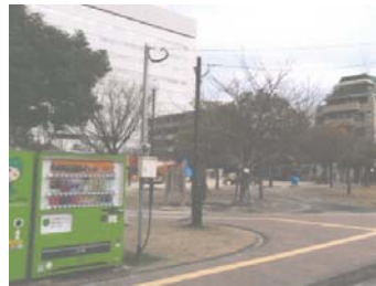
・防犯カメラの設置 （福岡市補助金対象制度）