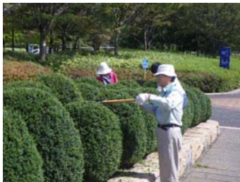
・地域内連携 （樹木の剪定や除草）