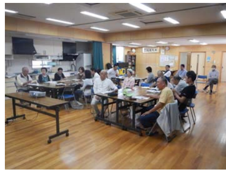
・第4回ワークショップの様子