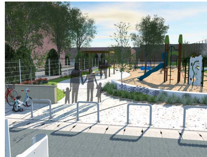
1 エントランス広場