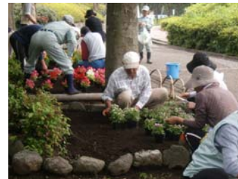
・地域の花づくり （福岡市補助金対象制度）

活動内容により報奨金や補助金対象制度があります。お問い合わせは、早良区維持管理課（☎833-4337）