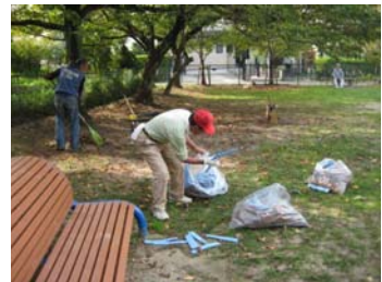
・公園愛護会 （清掃や施設の点検など）

福岡市では公園整備後の大原ハナミズキ公園を、安全で安心な公園として維持・管理していくために、地域のみなさまのご協力をお願いします。